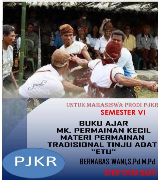
Gambar 1. Tampilan Cover Bahan Ajar Permainan Kecil Pada Materi Permainan Tradisional Tinju Adat“ Etu ”.

Contoh cover dari bahan ajar materi yang telah dikembangkan dapat dilihat pada gambar 1.