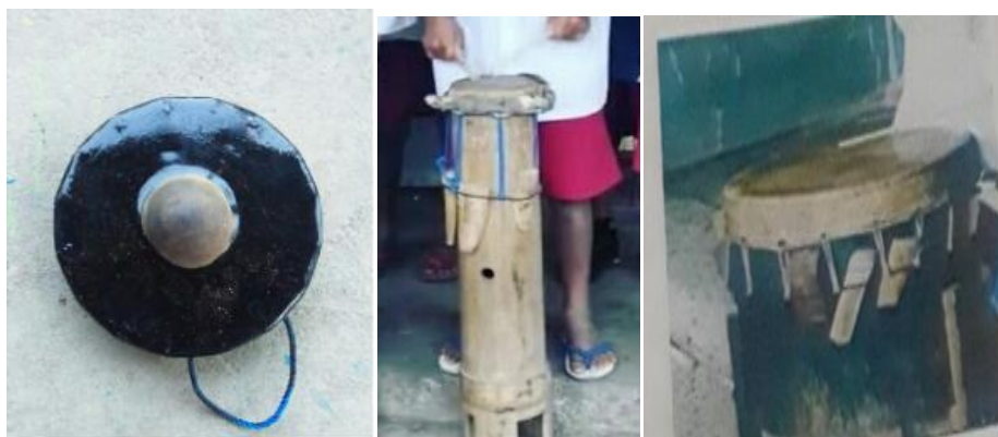
Gambar 1. Gong dan Gendang dalam Ansabel Go Laba