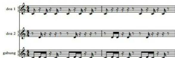
Pola Ritme Go Doa

Go Doa. Adapun Pola ritme go Doa yang dimainkan statis dari awal sampai akhir sebagai berikut