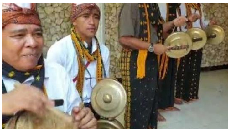
Gambar 2. Formasi Penyaji Musik Go Laba

Berdasarkan penuturan narasumber juga, bahwa formasi para penyaji musik go laba tidak terikat pada formasi tertentu, namun mengutamakan posisi yang nyaman ketika memainkan alat musik tersebut.